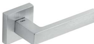
TUPAI 2275 Q 96 CHROM SATYNA dostępne również: 03 CHROM BŁYSZCZĄCY