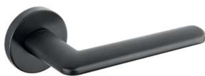
TUPAI 3098 153 CZARNY