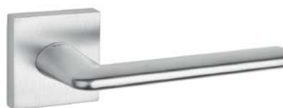
TUPAI 3098 Q 96 CHROM SATYNA dostępne również: 153 CZARNY