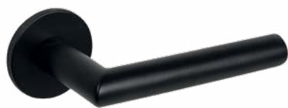
TUPAI 4152 5S Grubość rozety 5 mm 153 CZARNY 152 BIAŁY